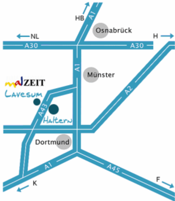
Abb.1: Anfahrtsbeschreibung zum Künstlerhof über die A43, Ausfahrt Haltern-Lavesum

Der Künstlerhof Lavesum befindet sich im Norden Lavesums, dem nördlichsten Ortsteil von Haltern am See in Nordrhein-Westfalen. Die einfachste Anfahrt erfolgt über die A43, Ausfahrt Haltern-Lavesum (Abb.1). Die zweite Abbildung zeigt die Anfahrt von der Autobahnabfahrt zum Künstlerhof Lavesum (Am Friedhof 25) über die L652 und die K44 .