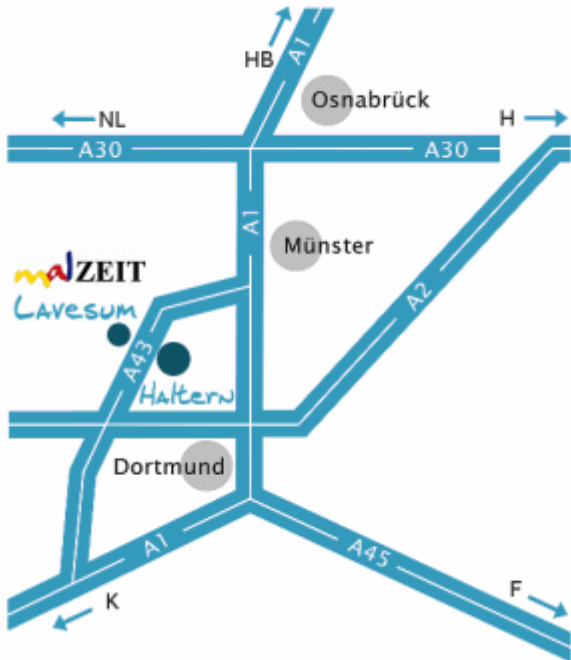
Abb.1: Anfahrtsbeschreibung zum Künstlerhof über die A43, Ausfahrt Haltern-Lavesum

Der Künstlerhof Lavesum befindet sich im Norden Lavesums, dem nördlichsten Ortsteil von Haltern am See in Nordrhein-Westfalen. Die einfachste Anfahrt erfolgt über die A43, Ausfahrt Haltern-Lavesum (Abb.1). Die zweite Abbildung zeigt die Anfahrt von der Autobahnabfahrt zum Künstlerhof Lavesum (Am Friedhof 25) über die L652 und die K44 .