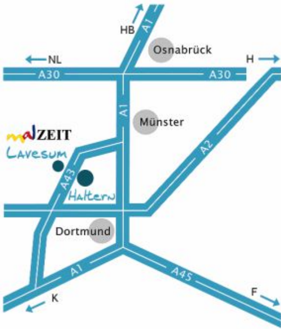
Abb.1: Anfahrtsbeschreibung zum Künstlerhof über die A43, Ausfahrt Haltern-Lavesum